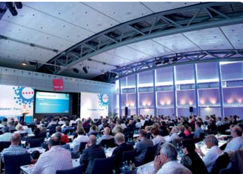
Das Eröffnungsplenum des Potsdamer Forums