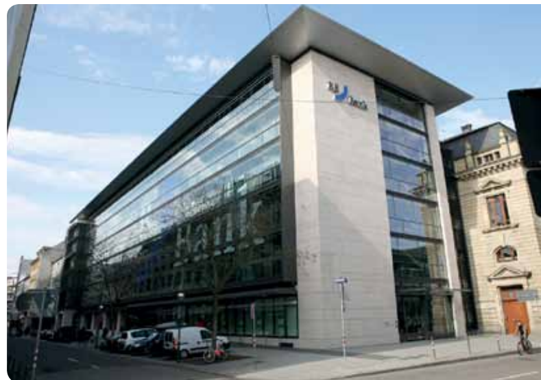
BBBank-Filiale in Karlsruhe

ren Themen von Beamten und Tarifkräften einzustellen. Beamte legen eben besonderen Wert auf gute Sachkenntnis und hohe Kompetenz. Die BBBank ist auch Partner beim RentenPlus des DGB und der Gewerkschaften im öffentlichen Dienst. Im Rahmen der Altersvorsorge von Beamten bietet die BBBank den Gewerkschaftsmitgliedern besonders vorteilhafte Sonderkonditionen an. Als einzige Bank in Deutschland hat die BBBank ein Verbandskonto speziell für die Gewerkschaften entwickelt. Mit dem Verbandskonto können die Gewerkschaften und oder ihre zigtausend Gliederungen