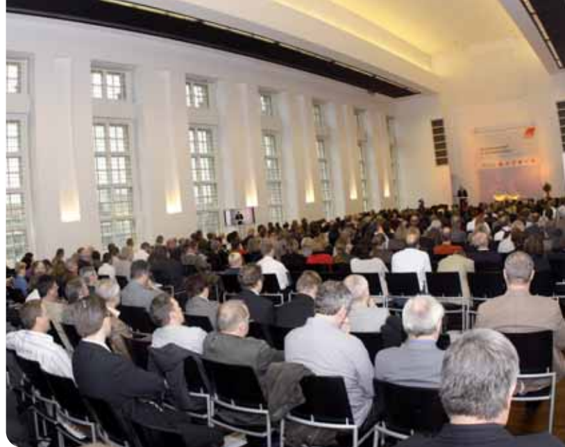
Den Nerv der Zeit getroffen: Das Thema des Forums stieß auf breites Interesse.

Der DGB hält den Ausstieg aus der staatlich geförderten Möglichkeit, die Arbeitszeit im Alter zu reduzieren, für falsch. Kammradt betonte, bei der Diskussion über Übergänge in den Ruhestand soll es keine „Privilegienregelung“