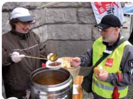
„Aktive Suppenpause“ vor dem Dienstsitz von Innensenator Erhart Körtling (SPD).

Rund 150 Beamtinnen und Beamte haben mit einer Aktion den Tarifverhandlungen für den öffentlichen Dienst Berlins Nachdruck verliehen. Bei einer „aktiven Suppenpause“ vor dem Verhandlungsort in der Senatsverwaltung für Inneres erinnerten sie an ihre Einkommenssituation. Seit 2004 wurde die Besoldung nicht erhöht. Das Land zahlt ihnen auch